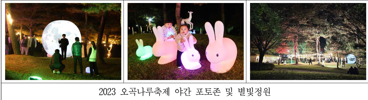
2023 오곡나루축제 야간 포토존 및 별빛정원