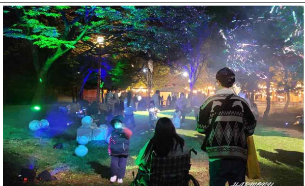
2024 여주오곡나루축제 몽유송원, 백자산책로